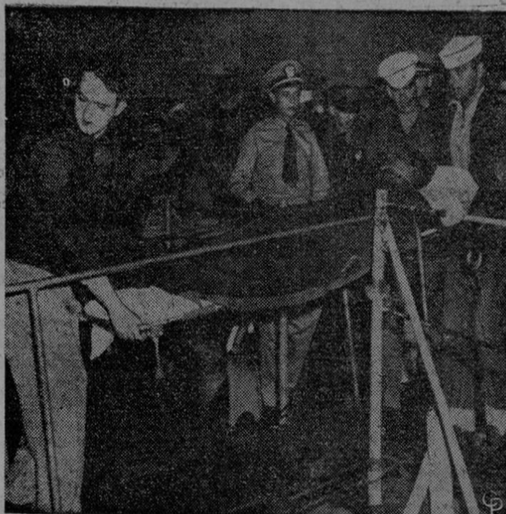
Recogido frente a Cabo Hatteras por el "U.S.S. Hollis" uno de los sobrevivientes del buque tanque panameño "Foundation Star" es sacado a tierra en Little Creek, Virginia. En el naufragio hubo 16 desaparecidos.

ahuyente la TOS y los RESFRIADOS tomando PULMOXIL